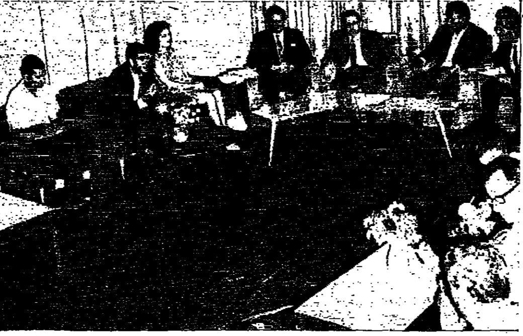
الدكتور غارسيا يتحدث الى الصحفيين خلال المؤتمر الصحفي الذي عقده امس في نقابة المحققين

انطباعات عضو في لجنة المحققين الدولية عن وقفة لا فرق لاضافة